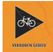
RA Rechts Af .

De markering is zoveel mogelijk rechts van de route aangebracht. Op enkele plaatsen aan de linkerzijde, of aan de overzijde van een kruising. Soms ook op de paaltjes van het wandelroute netwerk.