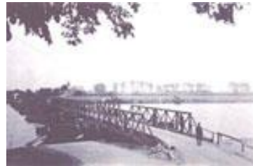
Duitse pontonbrug Mei 1940

In de borstwering van Veerhuis "De Staay" was in 1940 een kazemat verborgen. De Duitse troepen bouwden hier in Mei 1940 een ponton brug. Alle huizen langs de Staayweg, op 1 na, werden eind 1944 door de terug trekkende Duitse troepen in brand gestoken, ook het veerhuis "De Staay".