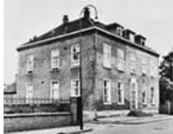
Huis ter Maas.