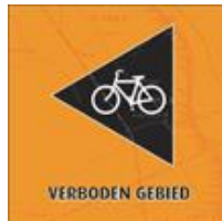
LA Links Af