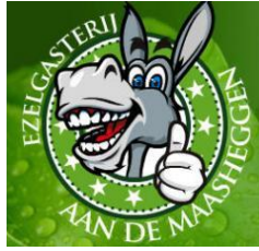
B&B, dagbesteding en zorgverblijf.

Langs de route ziet u de minicamping "De Brunk" vervolgens "B&B, Ezelgasterij", daarna komt u in Groeningen met, in het centrum een herkenbaar, driehoekig deel "De Schans" een kenmerk van een verdedigingswerk uit de vroege middeleeuwen.