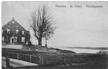
Veerhuis "De Staay"